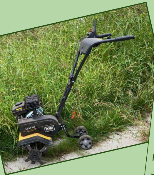
fre·zen (freesde, heeft gefreesd) 1 uitboren met een frees

Kortom we zijn met zijn allen het nieuwe schooljaar goed begonnen. Team obs Theo Thijssen